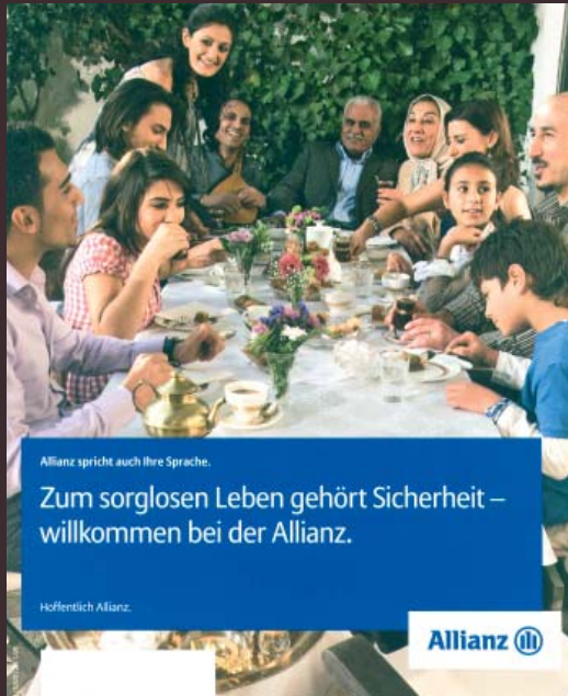
Kunde: Allianz Versicherung