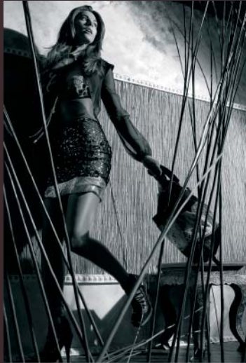
0171: Rock | Jeans - Leonard Bernini, Bluse | L'Oréal, Trench | Jil Sander, Schuhe | L'Oréal - Sportmax, „Amea, Kette | Versace | Schmuck - „Mango, Ansteckf | Versace - Ring Gürtel - Marni Hinter: Lager Koll und Oberholz | Trench und Top - „Levi's | Hemd, Kette und Ansteckf | Versace und Versace - Ring Gürtel - Marni